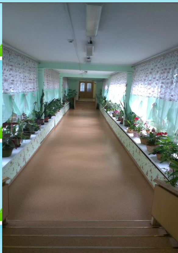
Переход между корпусами