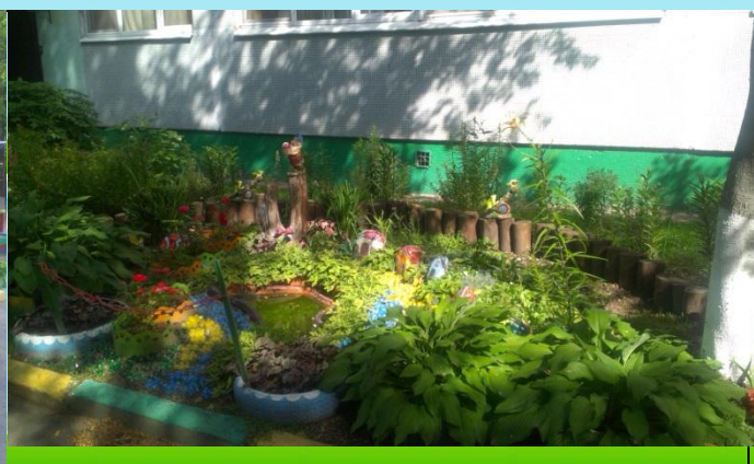
Территория детского сада