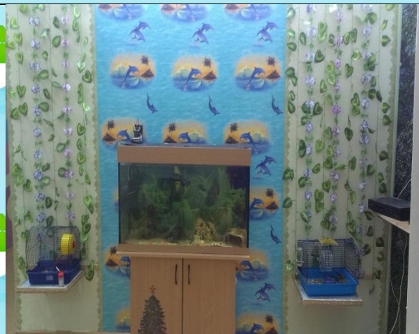
Живой уголок ДОУ

На территория детского сада созданы объекты, обеспечивающие личностно-ориентированную совместную деятельность детей и взрослых по следующим направлениям: оздоровительное, познавательное, эстетическое, игровое. На площадках каждой возрастной группы имеются веранды, песочницы и малые спортивно-игровые формы. Для поддержания физического здоровья детей оборудована спортивная площадка. Для развития познавательного интереса детей оборудованы искусственный водоём и огород, цветочные клумбы, по периметру здания расположены цветники. На территории детского сада с целью формирования навыков безопасного поведения имеется разметка проезжей и пешеходной части дороги.