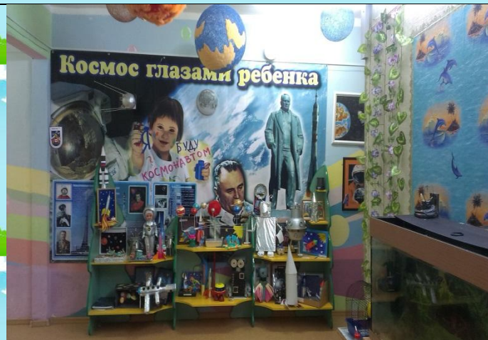
Музей ДОУ «Космос глазами ребёнка»