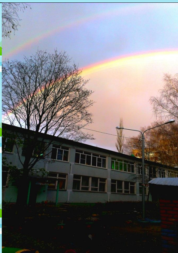
Детский сад № 33 «Березка»

Характеристики здания ДОУ: 2-х этажное блочное , 2-х корпусное соединённое теплым переходом ; фундамент – ж/б блоки, стены – кирпичные, перекрытия – ж/б плиты, кровля –мягкая (рулонная), полы – дощатые, покрытые линолеумом, общая площадь здания – 2907, 50 кв.м.