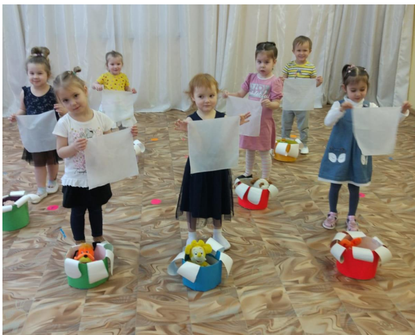
Активное слушание музыки в младшей группе. «Колыбельная» В.А. Моцарт